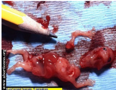
photo) : ce pauvre petit 'tas de viande', cet être à part entière, et ce dès sa conception, ayant une Âme éternelle qui coûta tout le Sang de son adorable Sauveur !

Donc ainsi étant libre, c'est elle, la femme, qui bien librement et volontairement va écarter les jambes (ou absorbe ces pilules criminelles) dans un acte de prostitution délibéré afin qu' 'eux', 'ils', puissent y plonger leurs mains hautement criminelles et en sortir ceci 64 (voir.